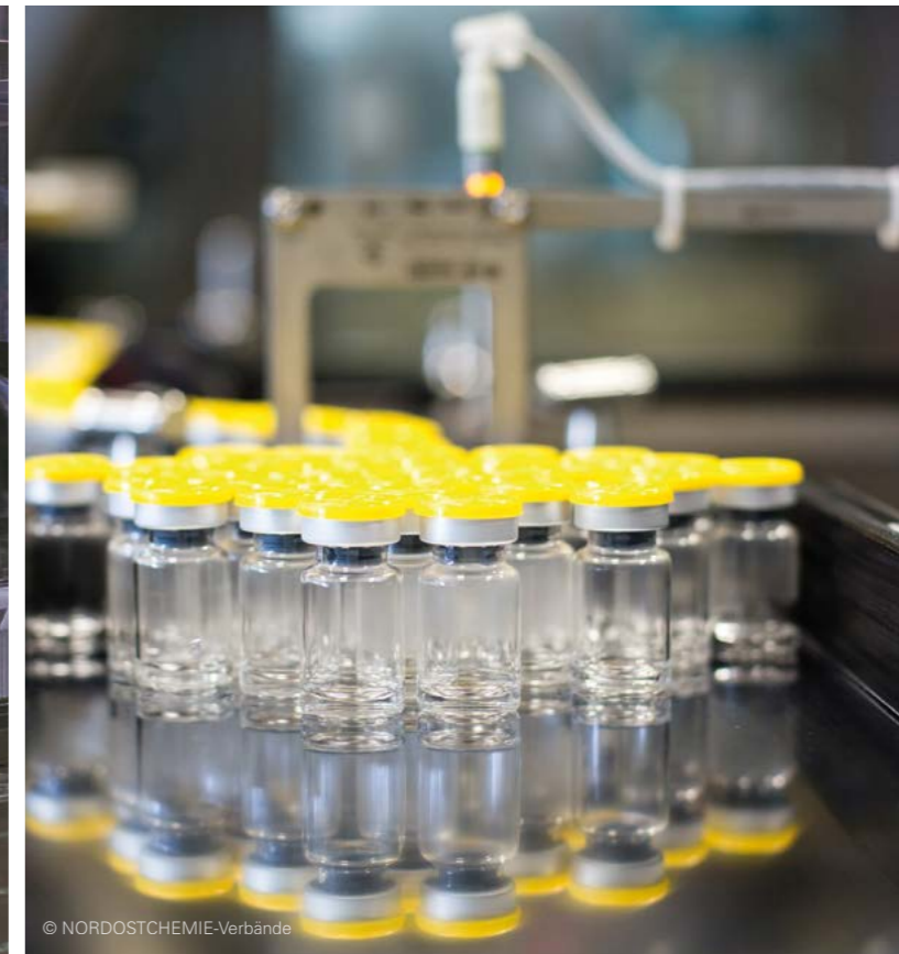
Blick in die Entwicklung des COVID-19-Impfstoffes und erste Abfüllungen

Impfung zur Grundimmunisierung und eine zweite Impfung zur Auffrischung vorsieht. „Ein solcher Impfstoff wäre auch für die Immunisierung von Risikogruppen einsetzbar“, gibt sich Neubert vorsichtig optimistisch.